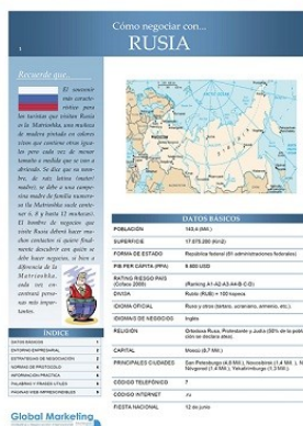
Cómo negociar en Rusia