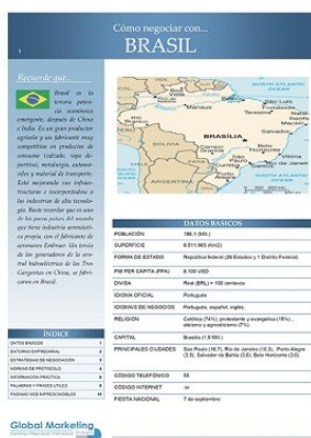
Cómo negociar en Brasil