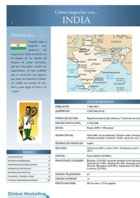
Cómo negociar en India

Compra Online www.globalnegotiator.com marketing@globalmarketing.es