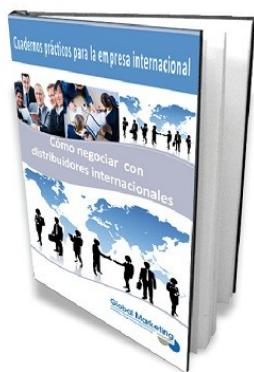
Cómo negociar con un distribuidor internacional