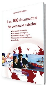
Los 100 documentos del comercio exterior