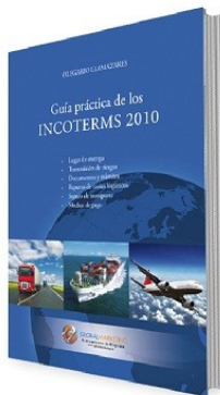
Guía práctica de los Incoterms 2010