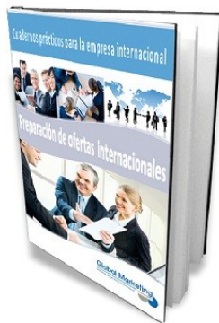
Cómo preparar una oferta internacional