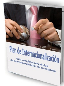
Plan de Internacionalización